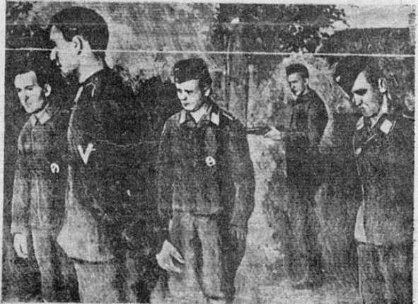
Un soldado del Ejército Rojo, el que está armado custodia a cuatro aviadores nazis, capturados des pues de un infructuoso raid sobre Moscú. Tello fue enviada de Moscú a Nueva York.